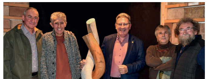
Fritz Liedl: Ausstellung „Der Tanz. Skulpturen aus Holz und Stein“