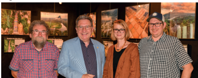
Fotoausstellung: Von Nickelsdorf um die Welt