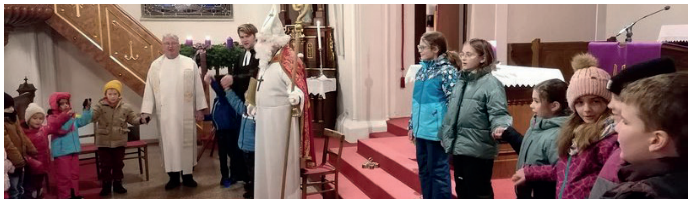
Text und Fotos : Francis Rijo und Gerlinde Limbeck