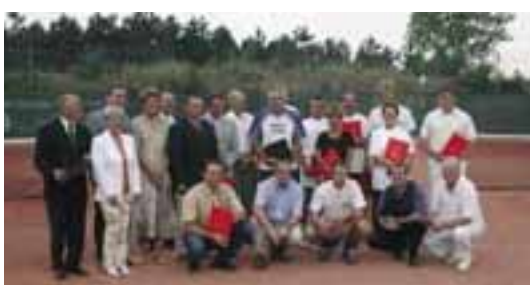
der Ehrung verdienter Funktionäre...