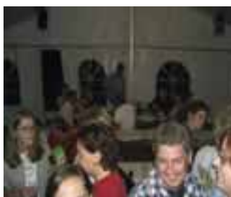
bis in die frühen Morgenstunden!