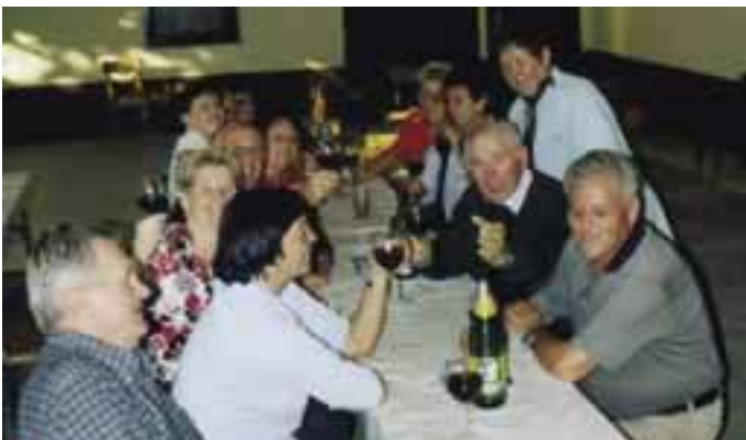
gute Stimmung herrschte beim Frühschoppen in der Pension Theresia nach der Guten Morgen Wanderung

www.raiffeisenclub.at www.wohnbausparen.at www.raiffeisen-versicherung.at