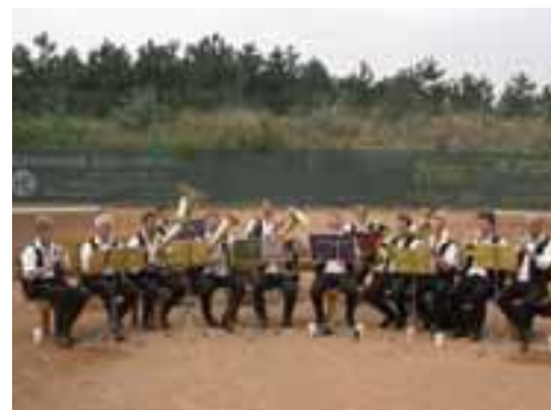
gefolgt vom Musikverein Nickelsdorf...