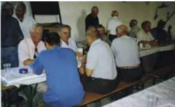
Sommerausklang des ÖKB mit Sautanz der bereits traditionelle Sommersausklang des Kameradschaftsbundes fand auch heuer wieder großen Anklang in der Bevölkerung.