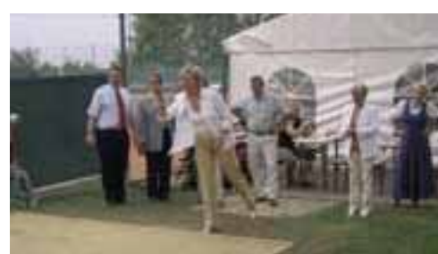
die Eröffnung des Boccia-Platzes...