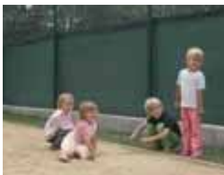
und „Jung“ hielt die Stimmung...