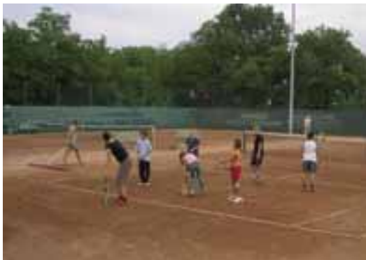
Den Beginn machte der Nachwuchs mit einer Tanzeinlage...