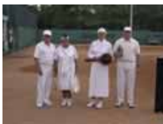
gefolgt von einem Nostalgiespiel im Stile der 20er Jahre...