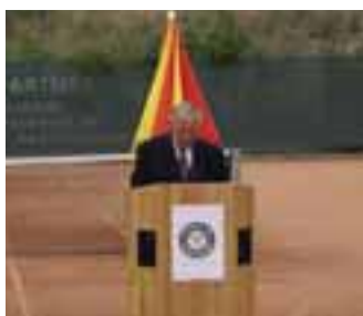
der Ansprache des Obmanns...