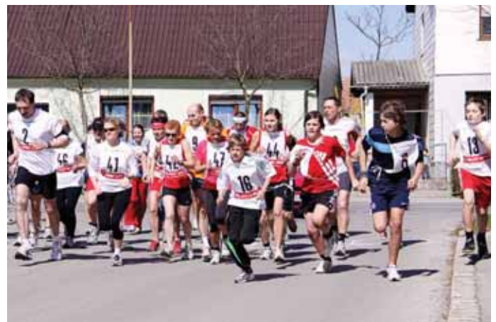
Start des Erwachsenenbewerbs beim Osterlauf