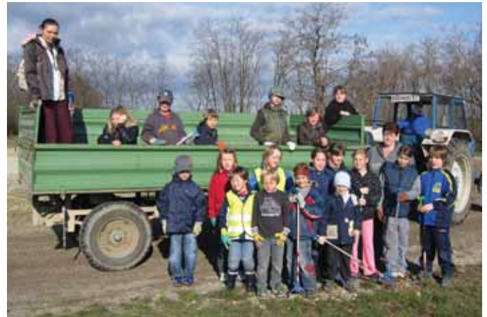
Wer findet mehr? Den Kindern (einige davon im Bild) war es streckenweise fast zu sauber auf unseren Feldern.