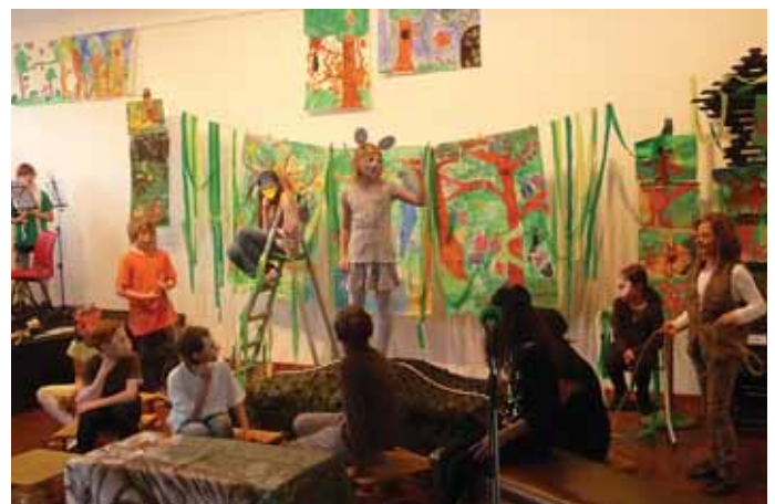
Wichtig sei die gemeinsame Freude, meint die kluge Maus Nosey Fred, die Frage nach dem König dagegen weniger.