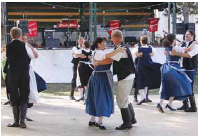
Kirtag der Vereine