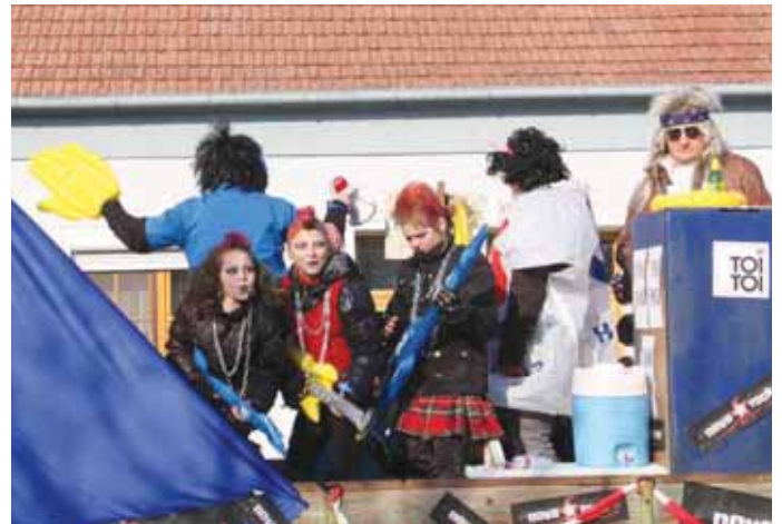
1. Nickelsdorfer Noarn-Gaudi