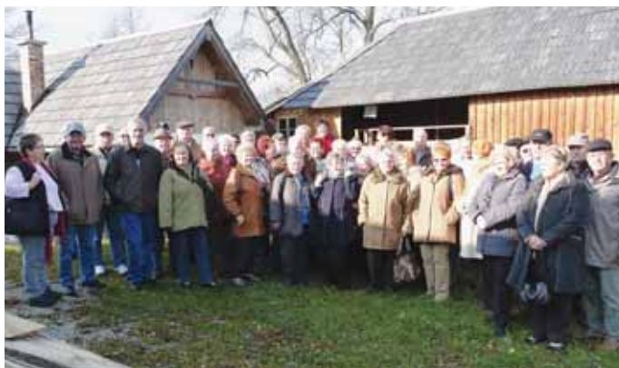
Nickelsdorfer Pensionisten bei der „Schneeberger Säge“

Gut Aiderbichl. Nach einer Führung und winterlichen Spaziergängen mitten unter den freilaufenden glücklichen Tieren konnte man auch schon schöne Weihnachtsgeschenke kaufen.