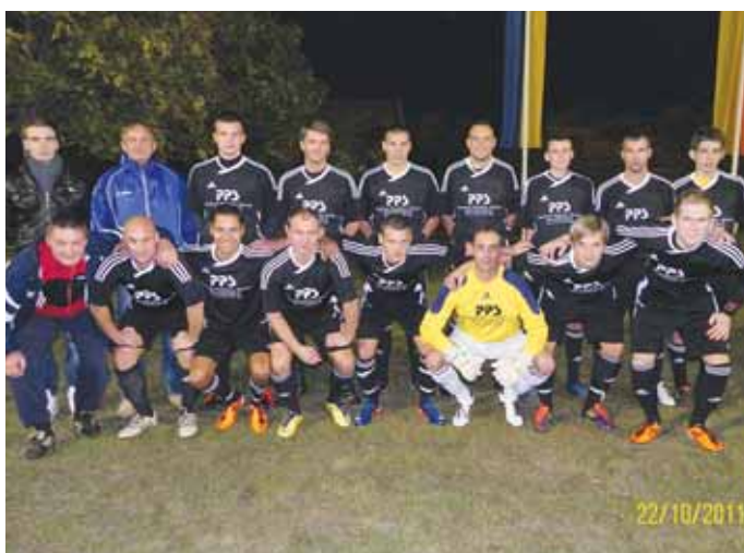
Die erfolgreiche Mannschaft des ASV Nickelsdorf