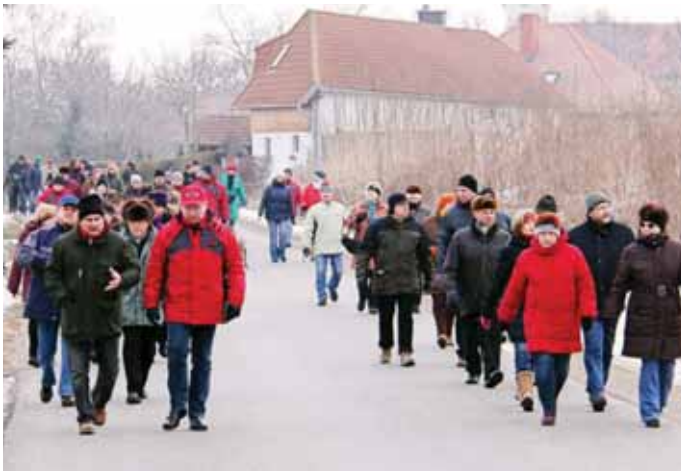
SPÖ-Winterwanderung am Dreikönigstag